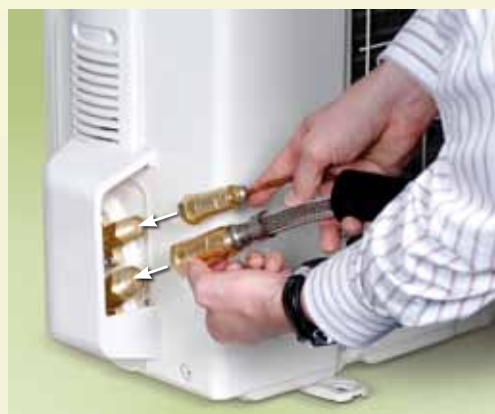
Jednoduchá montáž díky systému rychlospojek